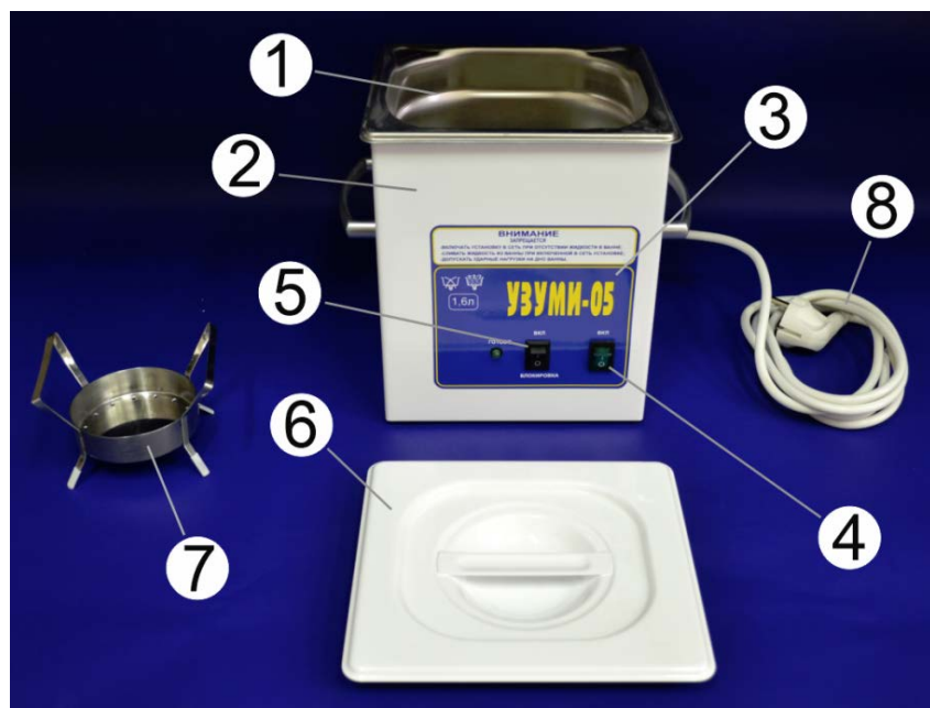
Рис. 1. Общий вид установки "УЗУМИ-05". 1 - ультразвуковая ванна; 2 - корпус установки; 3 - лицевая панель; 4 - сетевой переключатель; 5 - переключатель блокировки включения ультразвука; 6 - крышка ванны; 7 - поддон-кассета; 8 - сетевой кабель.

Внимание! Для качественной отмывки стоматологических боров и другого инструмента использование поддона-кассеты обязательно.