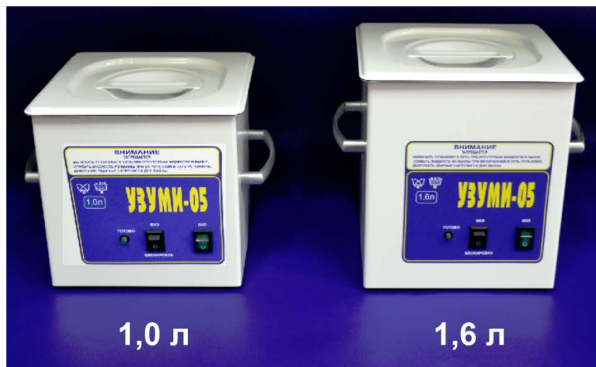
Рис. 2. Линейка установок "УЗУМИ-05" с разными объемами ультразвуковой ванны.